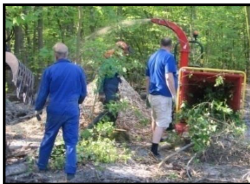
Gezond buiten “werken”