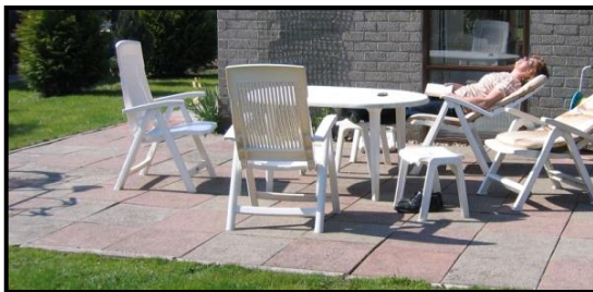
Lekker luieren in de zon