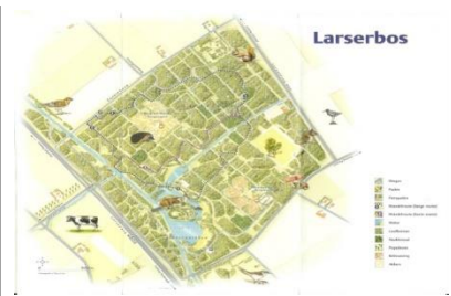
Lekker wandelen, fietsen in het bos

Staangeld 2022 € 960,= is inclusief: Verzekeringen, Belastingen, WOZ, riool, kabel TV, grote speeltuin, etc.